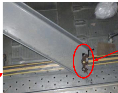
接合部のボルトが破断

梁のような鉄鋼の仕様 長さ約5.6m、幅約25cm、高さ約10cm 厚み約10～13mm、重さ約200kg