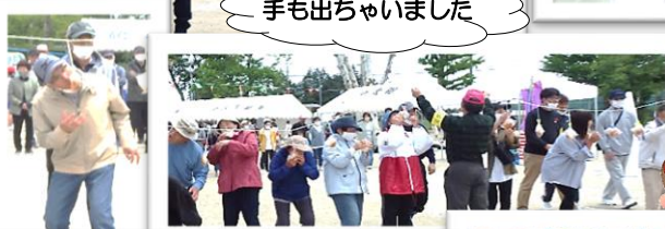
手も出ちゃいました