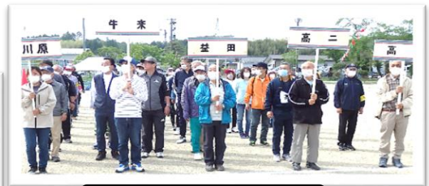
地区の皆さんも整列です