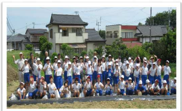
大甕小学校児童と地域の皆さんで記念撮影