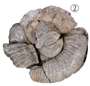
新しく市文化財に指定された3種の標本。いずれも鹿島区から産出したもの。