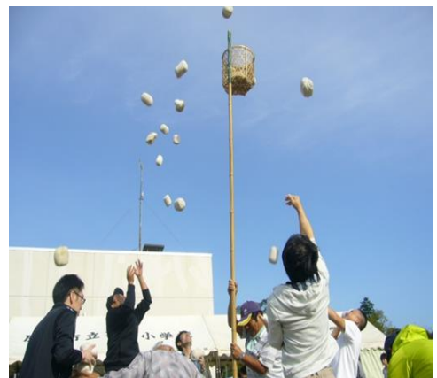
地区対抗玉入れ競技に盛り上がり ました