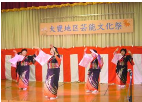
大甕手踊り民舞のみなさん