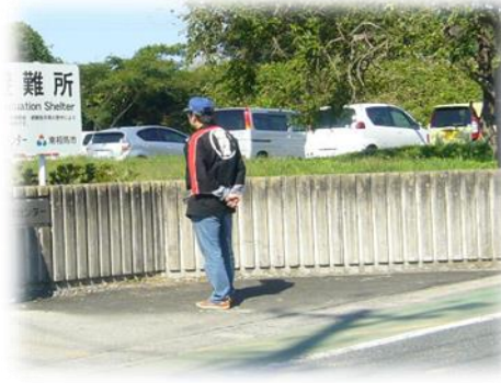
駐車場の警備に消防団の皆さんにお世話になりました。