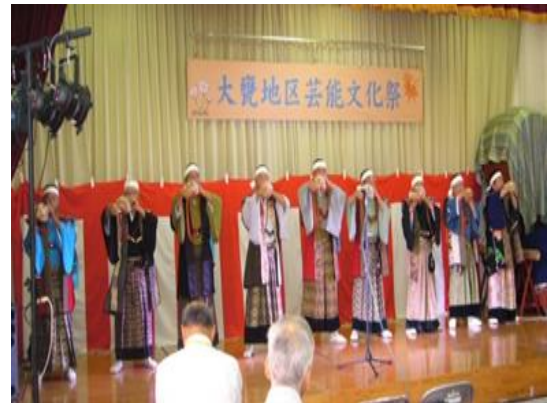
ひばり法螺貝愛好会の礼螺で幕開け