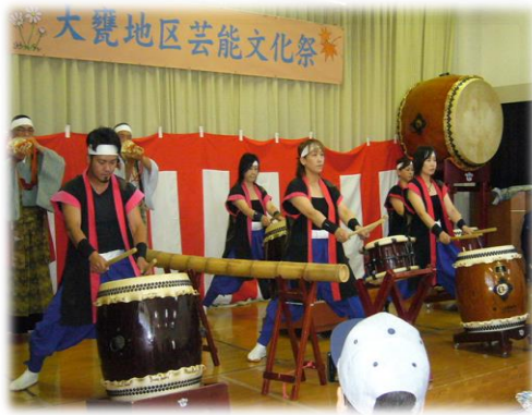
勇壮な和太鼓の演奏でした。