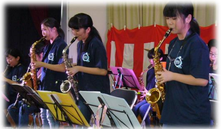
原町第三中学校吹奏楽部の皆さん。 素晴らしい演奏に拍手喝采でした。