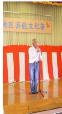
区長会長あいさつ