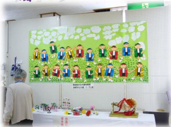
園児の作品に癒されました。