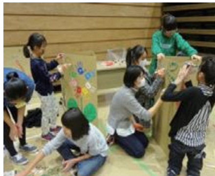
③三角柱の段ボールに馬の名前や参加者の寄せ書きなどを描きました。