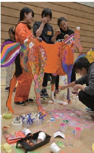
②(2日目)自治体の特色など絵柄を馬に描きました。