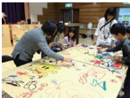
②段ボールをキャンバスにいろいろなキャラクターができあがりました。