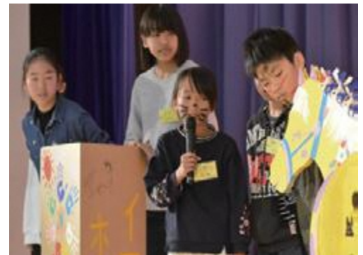
④完成した作品を各班で発表しました。