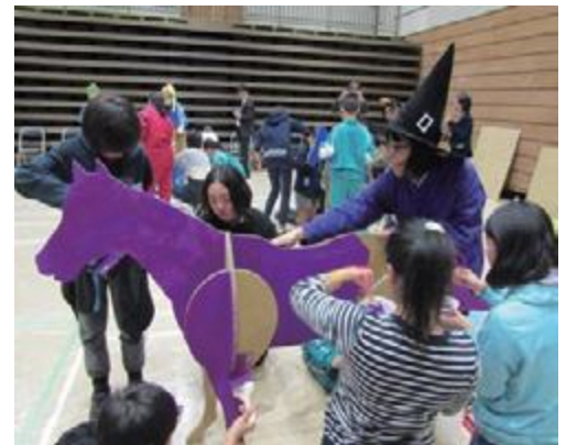
①(1日目)参加者は8班に分かれ、1グループ6人で馬1体を制作し、班ごとに異なる彩色をしました。