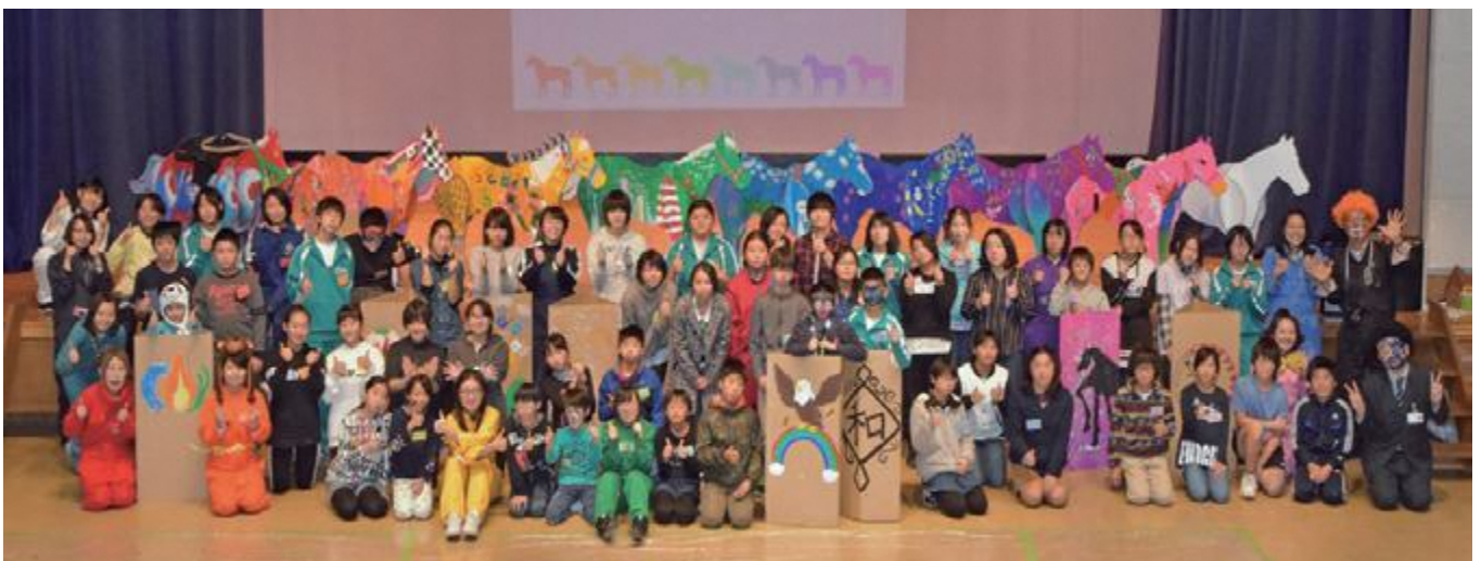
⑤最後にみんなで記念写真を撮影しました。馬を並べるとレインボーカラー(虹色)になります。