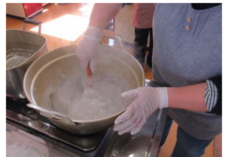
④こまかく切り1杯のぬるま湯に浸す。⑤ぬるま湯を加えながらミキサーに掛ける。