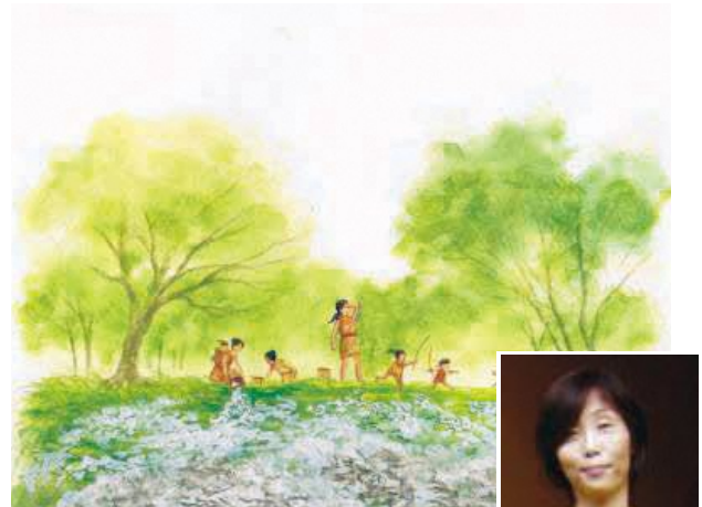
浦尻貝塚における縄文時代の暮らしのイメージ 絵: 安芸 早穂子氏

※新型コロナウイルス感染症の流行拡大により、中止も含め予定を変更する場合があります。