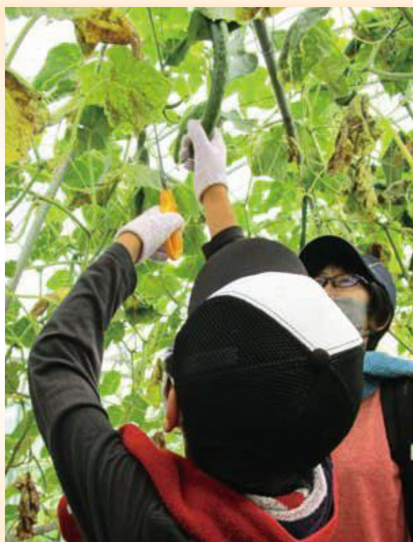
令和2年度子ども自然体験学習事業（野菜収穫体験）