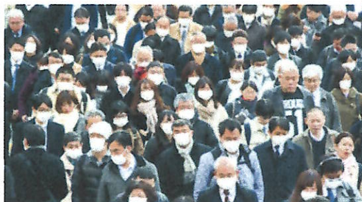
混雑する場所・時間帯を避け、人との間隔を十分とりましょう。