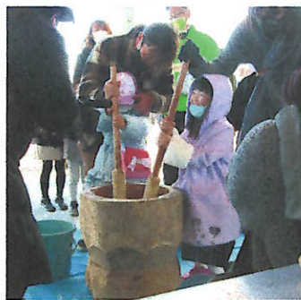
鏡餅づくり餅つき大会にはチビッコも参加。

ひがし地区恒例の「冬まつり」「文化祭」を十二月二十日に道の駅南相馬・ひがし生涯学習センターで開催しました。 今回は、新型コロナウイルスの関係で規模を縮小して開催しましたが、四八〇名の方々が集まってくれました。 参加いただいた皆さまには、ウイルス感染防止対策にご協力いただき、ありがとうございました。 無事終了できましたことに感謝申し上げます。