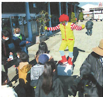
ジャンケンマンもマスクして大活躍。