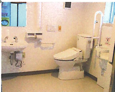
出入口を大きく取り、ベビーベット・チェアなども完備

この度、センター内に「多目的トイレ」が完成しました。乳幼児や高齢者の方には使いやすい機能を備えています。