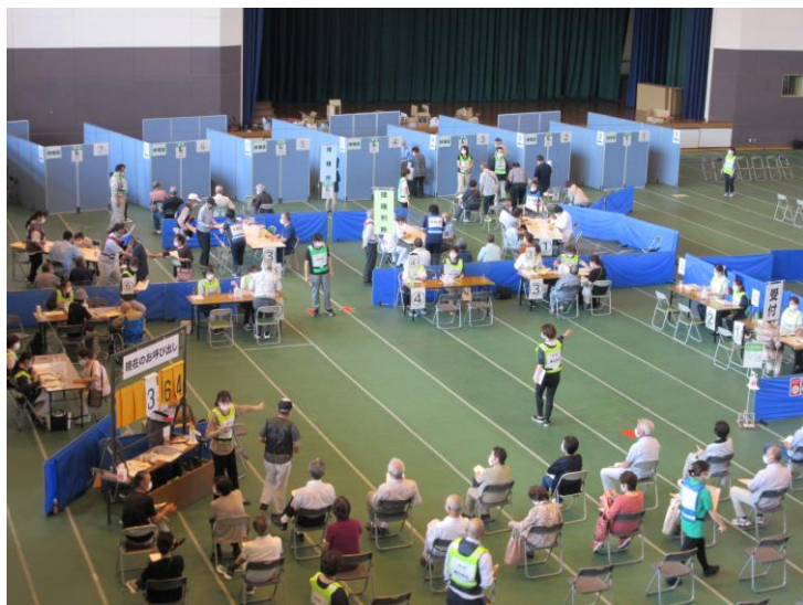
ワクチン接種会場の風景（南相馬市スポーツセンター）