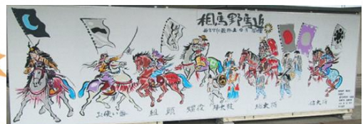
原ノ町駅ホームを彩る野馬追絵巻(原画：朝倉悠三)

平成23(2011)年5月より福島民報にて『震災絵日記』を連載し、令和元(2019)年に79歳で亡くなるまで創作活動を続けられました。