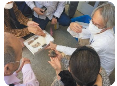
土偶「うらこちゃん」に触れる参加者

※第1部の映像は、次の市HPから博物館YouTubeでご覧いただけます。 https://www.city.minamisoma.lg.jp/portal/culture/geijutsu_bunka/5/15525.html