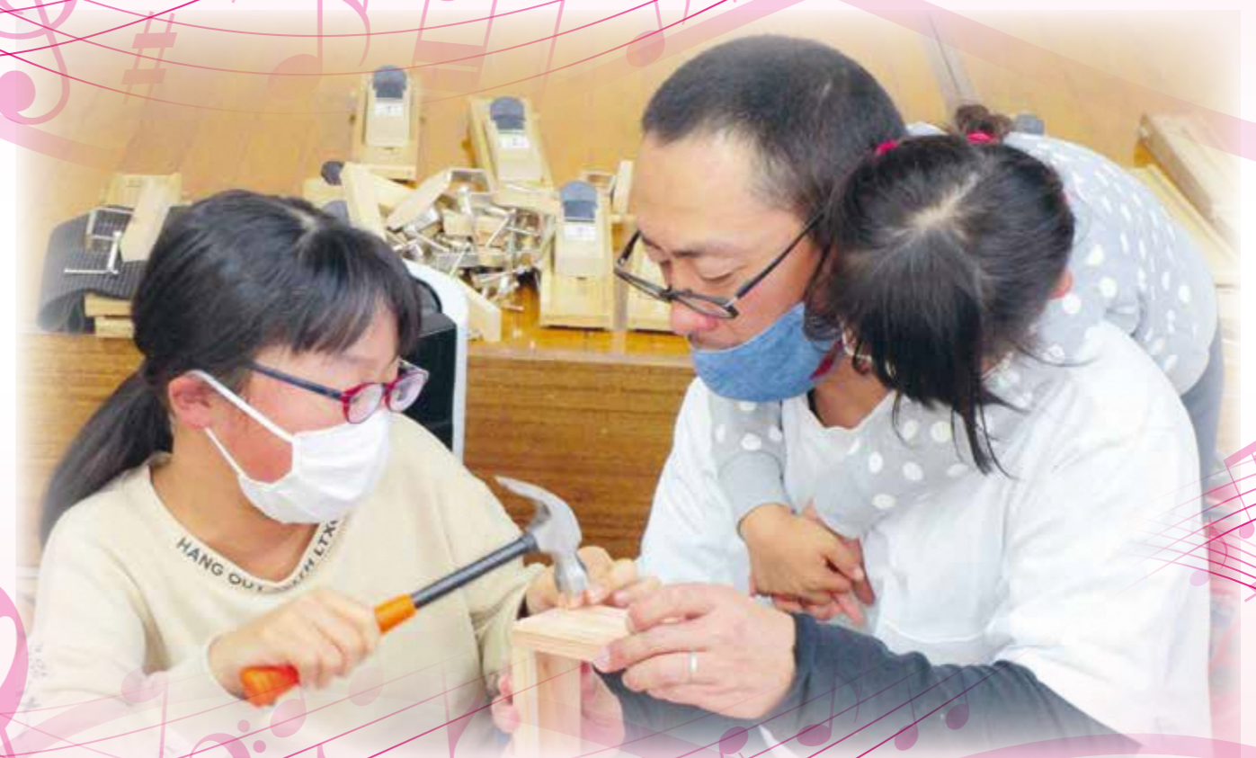
親子ふれあい森林学習

「は～もにいい」には、「調和」や「和音」という意味があります。男女がお互いに尊重し、支え合い、仕事と家庭のよりよいバランスを考えていくことによって、より心地よくもっと心に響くハーモニーを奏でられたら…そんな願いをこめて本紙に名付けました。