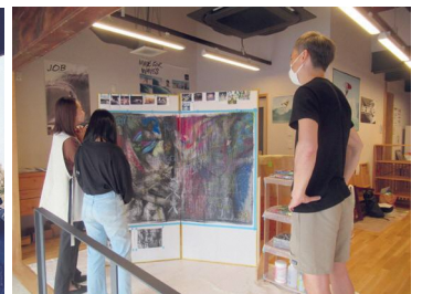
MUROHARA SURFBOARD PRODUCTION