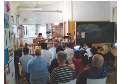
小高駅フリースペース