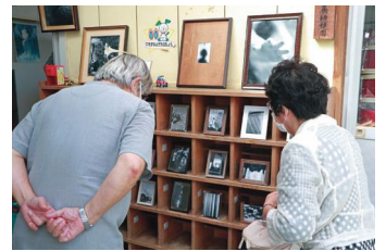
小高教会幼稚園玄関