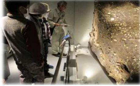
7月にオープンした浦尻貝塚観察館