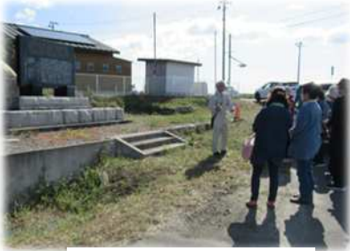
塚原にある報徳碑

今回は、南相馬市職員の案内で、南相馬市小高区に残る報徳仕法の史跡の他、7月にオープンした浦尻貝塚観察館、大悲山薬師堂石仏等小高区にある国指定の史跡を巡りました。先人たちが残してくれた知恵や労力に感動しながら、理解を深めてきました。