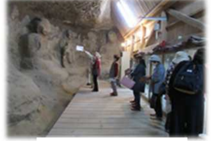
大悲山薬師堂石仏