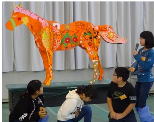
①ダンボールの馬に絵柄を描いていきます。