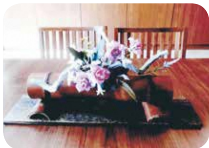
【ハンドメイド・ものづくり】No.117 竹細工講座 講師：只野義孝