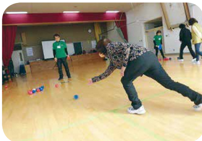
【運動・ダンス】No68 白いボールをねらえ！ポッチャマン 講師：はらまちクラブ