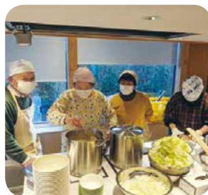
【くらし・学び・教養】No.3 こども食堂立ち上げ講座 講師：おだか0円食堂