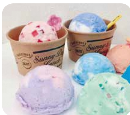
【ハンドメイド・ものづくり】 No.68 香育教室 アイスクリューム石けん 講師：小林香代子