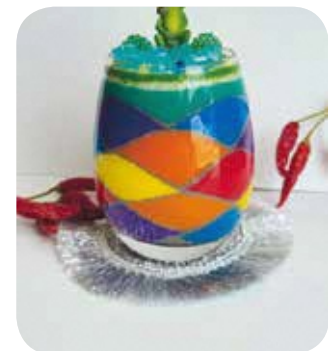
【ハンドメイド・ものづくり】 No.58 グラスサンドアート教室 講師：清香織