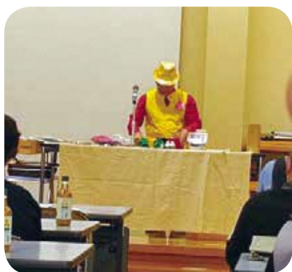
【くらし・学び・教養】No.1 マジック披露 講師：原町マジック研究会