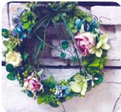
【ハンドメイド・ものづくり】No.100 ミニフラワーアレンジ 講師：新川智子