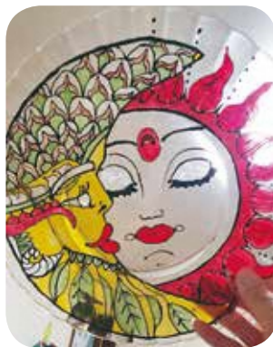
【ハンドメイド・ものづくり】No.108 モロッカプレート 講師：清香織