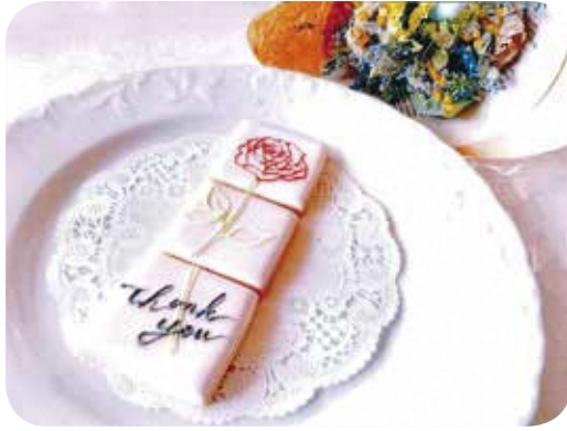
【料理】No.77 アイシングクッキー教室 講師：大和田純子