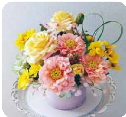
【ハンドメイド・ものづくり】No.101 フラワーアレンジメント 講師：松倉里美