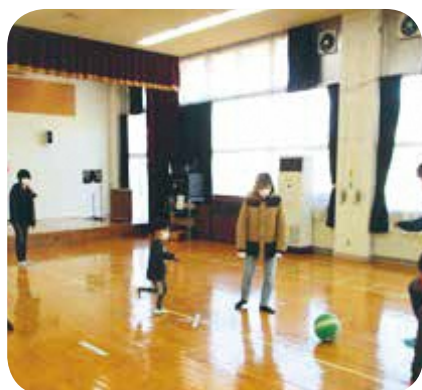
【運動・健康】No.27 歩いて・笑って・健康に！ウォーキングフットボール 講師：はらまちクラブ