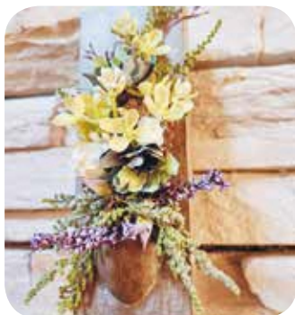
【ハンドメイド・ものづくり】 No.51 ミニフラワーアレンジ 講師：新川智子