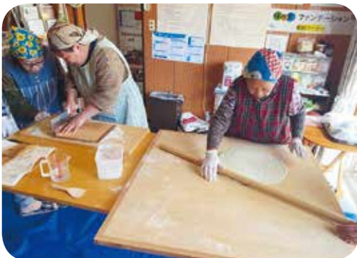
【料理】 No.131 そば打ち体験 講師：そば食べて百まで自分を活かす会