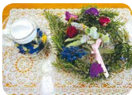
【くらし・学び・教養】No.17 ハーブ講座 講師：横山香代子