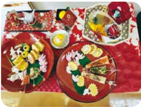
【料理】 No.125 フライパンで作る料理 講師：新川智子