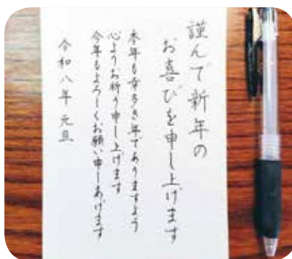
【絵と書】No.26 実用ペン習字講座 講師：鈴木千秋