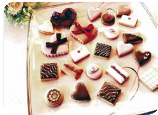
【料理】 No.130 アイシングクッキー教室 講師：大和田純子