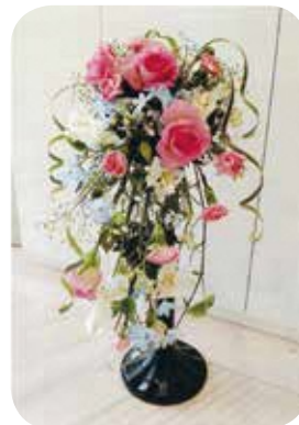
【ハンドメイド・ものづくり】No.103 フラワーアレンジメント 講師：海老原由香