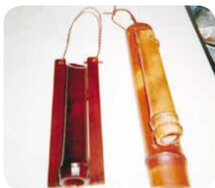
【ハンドメイド・ものづくり】 No.65 竹細工講座 講師：只野義孝