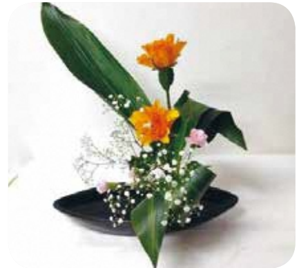
【伝統・文化】No.146 モダンな生け花 講師：大和田広実