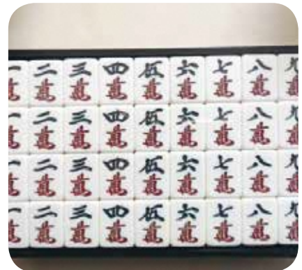
【健康・心】No.42 健康（脳トレ）麻雀のすすめ 講師：森岡賢治