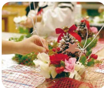
【ハンドメイド・ものづくり】 No.55 かわいいフラワーアレンジ作り 講師：大和田広実