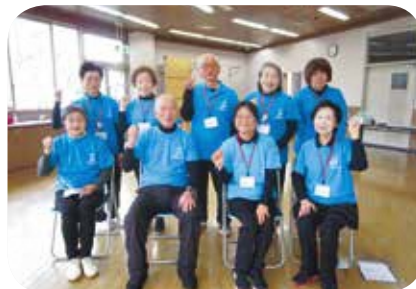
【運動・ダンス】No78 もりあげ体操で元気モリモリ！ 講師：元気モリモリもりあげ隊