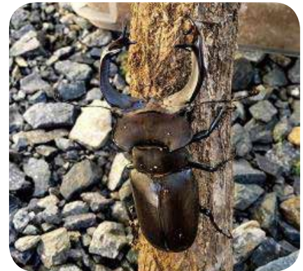
【子育て】No.137 世界のカブトムシ、クワガタムシのお話し 講師：森岡賢治