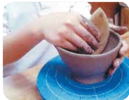
【ハンドメイド・ものづくり】No.116 陶芸体験 講師：大甕陶芸クラブ