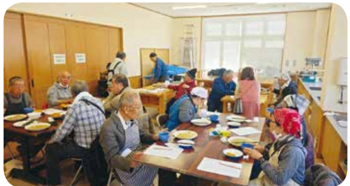
【料理】 No.132 そば切りからそばを食べる 講師：そば食べて百まで自分を活かす会