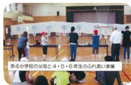
【運動・健康】No.39 スポーツウエルネス吹矢 講師：(一社)日本スポーツウエルネス 吹矢協会相双おおみか支部