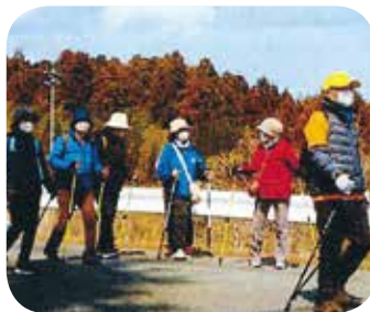
【運動・ダンス】No.91 ノルディックウォーキング教室 講師：南相馬ノルディックウォーキングの会