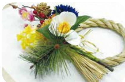
【ハンドメイド・ものづくり】No.104 楽しいフラワーアレンジ作り 講師：大和田広実