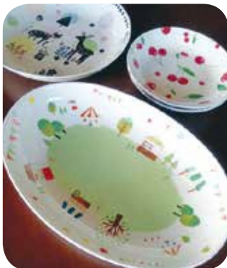
【ハンドメイド・ものづくり】No.119 ポーセラーツ体験講座 講師：佐藤由美