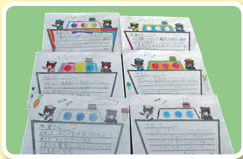
子どもたちからの手紙

先日、地元の小学校の社会科見学があり、子どもたちは、野菜やトラクターを見て喜んでいました。その際、子どもたちからお礼の手紙をもらうことができ、励まされ、元気をもらいました。