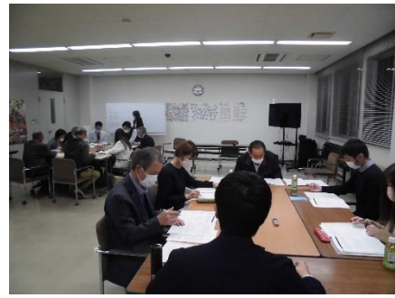
2グループに分かれて意見を交わしている様子

その後、前回と同じグループに分かれ、事務局より提案のあった条文(案)の内容について、意見を交わしました。議論終了後は、両グループで出された意見の共有を行いました。