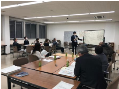
両グループの意見を共有している様子

12月14日(火)に予定しており、第2回で出た意見を受けて修正した条文(案)を委員の方々と共有する予定です。また、本条例名について委員の方々と意見を交わします。検討分科会については、全3回をもって終了となり、12月17日(金)に開催する子ども・子育て審議会へ報告する予定です。