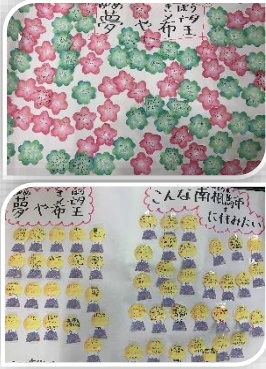
子どもたちからの夢や希望を委員の方々と共有