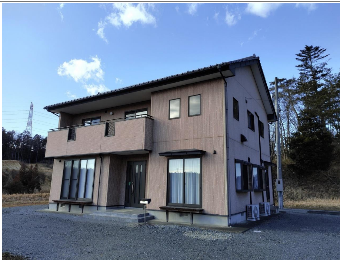
(12) 写真 (外観)