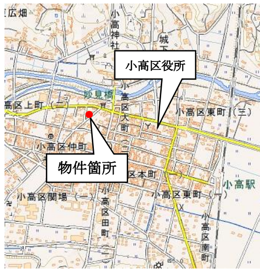
(10) 位置図