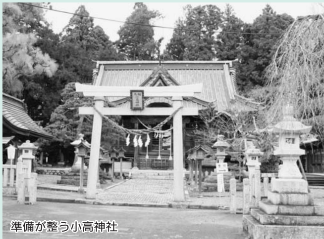
準備が整う小高神社