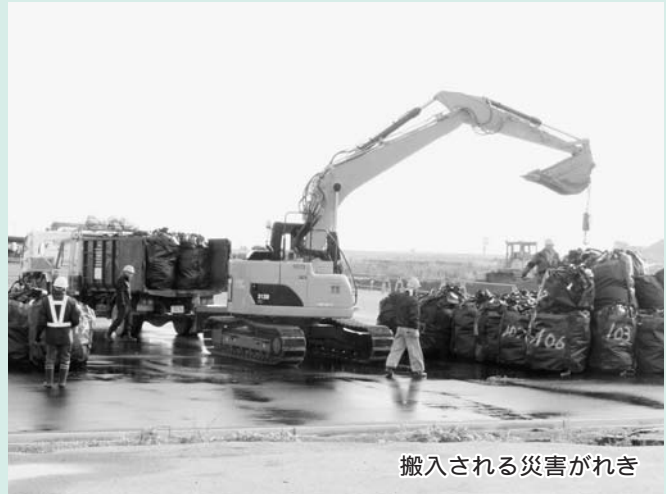
搬入される災害がれき

また、同じく沿岸部に設置予定の小沢地区、村上地区、浦尻地区のがれき置き場は、地元の合意をいただき平成25年前期・中期の着工を目指して具体的な作業に入りました。旧警戒区域内の推定されるがれき量は約18万3千トンで、これら进行处理するには数年かかる見込みです。一刻も早くがれきを処理し、震災前の環境を取り戻したいものです。