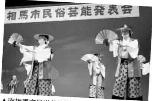
▲南相馬市民俗芸能発表会