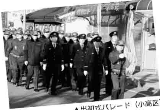
▲出初式パレード (小高区)