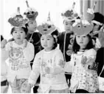
▲どんなお面ができるかな？

ところ 原町子育て支援センター 対象 1歳から就学前のお子さん とその保護者 参加費 無料 定員 親子15組(先着順) 申込期限 1月16日(金) 申込先・問合せ 原町子育て支援センター ☎②4558