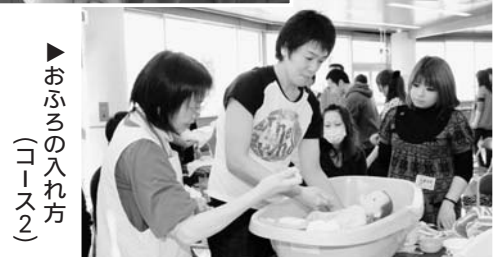
▶ お風呂の入れ方 (コース2)