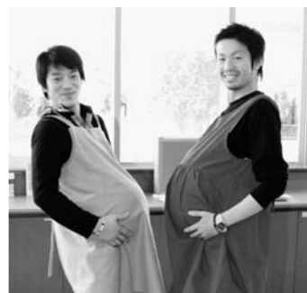
◀ 妊婦疑似体験 (コース2)

と き 2月15日(火) (受付時間：9時15分～9時30分) ところ 鹿島保健センター 持参物 母子健康手帳、エプロン、三角巾 参加費 200円 申込先・問合せ 鹿島区健康福祉課 ☎ 1 4 5 1