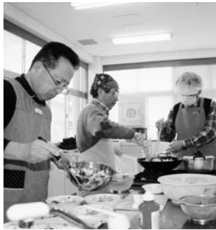
▲みんなで楽しく調理実習

料理の経験がない方はもちろん、料理のレパートリーを増やしたい方など、奮ってご参加ください。