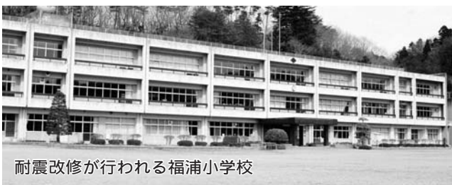
耐震改修が行われる福浦小学校