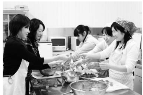
▲楽しくクッキング!

対象者 2・3歳の未就園児とその保護者 お子さんのみの参加はできません。必ず保護者または保護者に代わる方が同伴で参加してください。