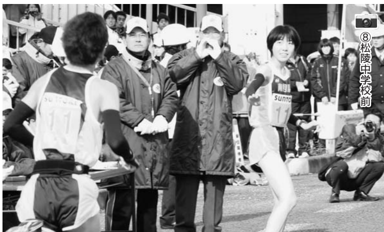
▶タスキリレーはもうすぐ