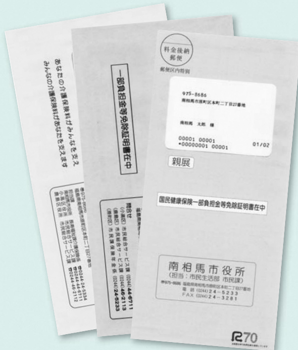
国保は薄紫色、後期は茶色、 介護は水色の封筒です。

対象とみられる場合でも、市が所得額を正しく把握できない場合、免除書類を交付できません。