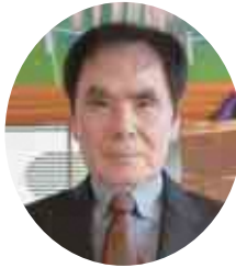
● 瑞宝双光章 ●

消防長で退職するまでの35年間、自身の研鑽だけでなく、資機材の整備や医療関係者との協力体制の構築といった、速やかな救急医療行為につながる「隊員が活動しやすい環境」づくりを奔走しました。「支えてくださった皆さんに感謝したい」