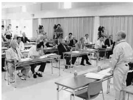
▲「東日本大震災復興 相馬三社野馬追」を発表した執行委員会総会

その結果、10年前の6月18日、相馬野馬追執行委員会総会において、「東日本大震災