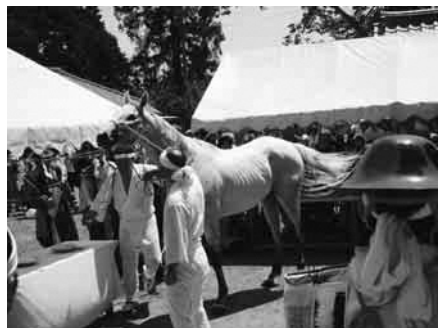
▲会場を多珂神社に変えて行われた「上げ野馬の神事」

復興相馬三社野馬追」の開催が正式発表されたのです。相馬野馬追の伝承にとって大きな意義を持つ「開催」の決断でした。翌7月23日、25日、1日は原発事故規制区域外の相馬市・鹿島区で「お繰り出し」、2日目は相馬太田神社で例大祭神事、3日目は相馬小高神社に変わって原町区高の多珂神社で「上げ野馬の神事」が行われ、内容を縮小しながらも伝統をつなぎました。