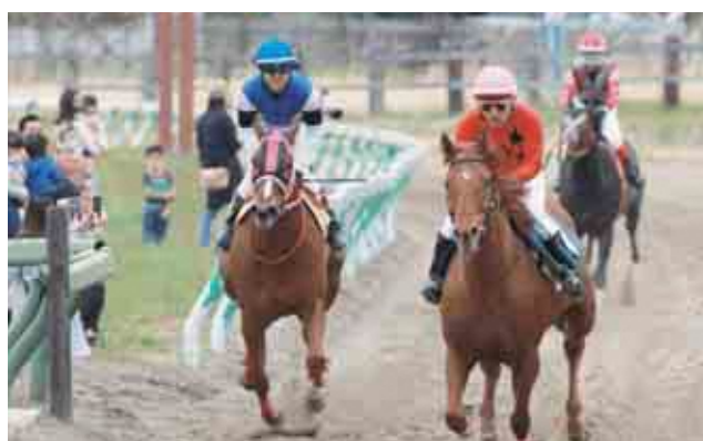
第75回相馬野馬追振興春季競馬大会・ノマハラマルシェ〈4月25日〉