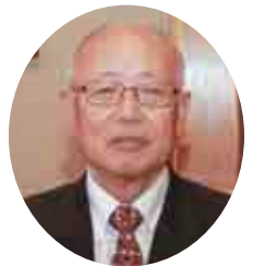
● 瑞宝双光章 ●

昭和42年に県巡査を拝命し、浪江・二本松・いわき南各署長を歴任。いわき南署長時代には民間交番の開設や、殺人事件の早期解決などに尽力しました。退職後は旧小高町商工会事務局長を務め古里活性化に力を注ぎました。現在は南相馬署で剣道講師として後進の指導に当たっています。