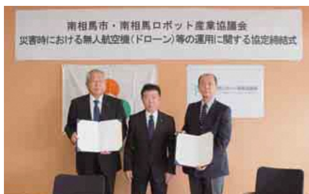
災害時における無人航空機協定の締結〈4月28日〉