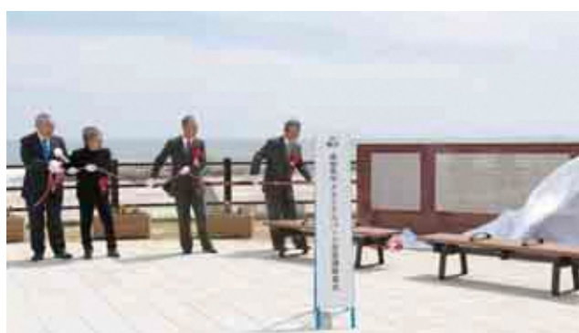
市メモリアルパーク開所〈4月24日〉