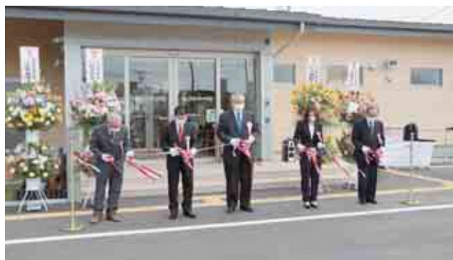
市健康づくりトレーニングセンター 「スキット千倉」開所〈4月18日〉