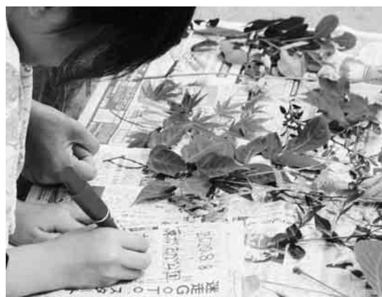
▲植物を押し花にするための下準備をする様子