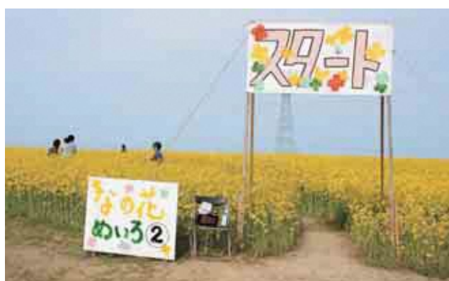
「なの花めいろ」開放〈4月24日〉