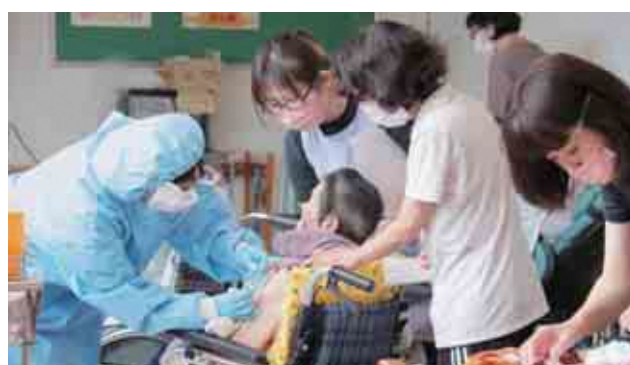
高齢者施設の入所者にワクチン接種開始 〈4月24日〉長寿荘