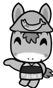
▲市ふるさと回帰支援センター マスコットキャラクター 「のまたん」

市では、子どもたちが家庭の経済的な状況に左右されず、夢や希望を持つことができる社会を実現するため、子どもの貧困対策に関する施策を推進する「第二期南相馬市子ども・子育て支援事業計画追加版(子どもの貧困対策に関する施策の追加)」を策定します。