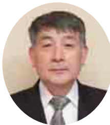
● 瑞宝単光章 ●

地域の「ゆうびんやさん」として、旧小高町の蛭沢郵便局を振り出しに磐城太田郵便局長を26年間務めました。現在も地元の太田大甕スポーツクラブ会長を務め、仲間とともに地域住民が運動を楽しむ環境づくりにも尽力しています。「先輩や同僚、地域住民の皆さんと家族の支えで勤め上げられました」