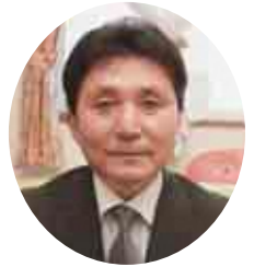
● 瑞宝双光章 ●