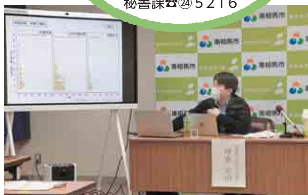
市コロナワクチン抗体検査の測定結果に関する会見 〈10月22日〉