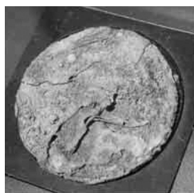
▲写真1 桜井古墳群出土青銅鏡 (7号墳)

残念ながら桜井古墳群から出土した青銅鏡は三角縁神獣鏡ではありませんでしたが、桜井古墳群に埋葬された有力豪族は、ヤマト王権以外の地域の有力豪族との関係でこの青銅鏡を入手し、当地方の支配者としての地位を確立したのでしょう。