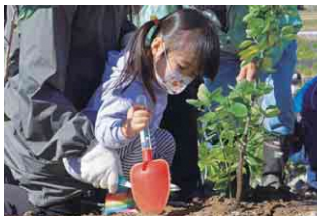
市鎮魂復興市民植樹祭〈10月24日〉