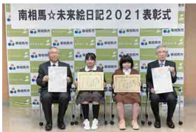
南相馬☆未来絵日記表彰式〈10月27日〉