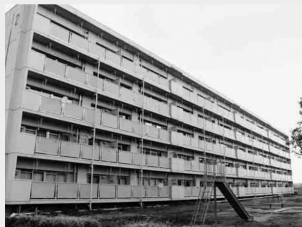
▲鹿島区定住促進住宅