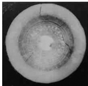
▲写真2 X線透過撮影画像