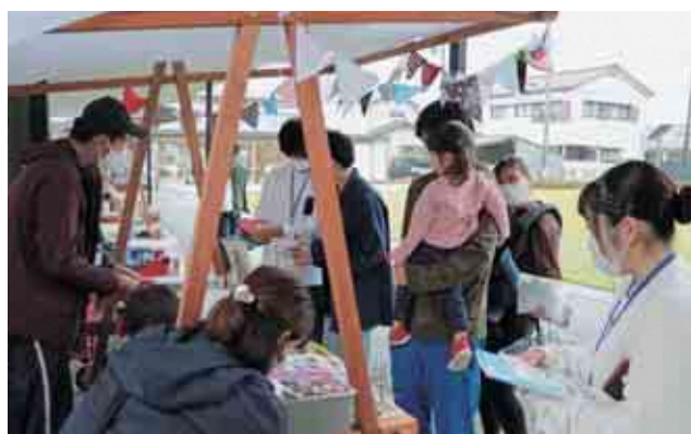
小高区文芸・美術作品展、小高つながる市 〈10月16日〉