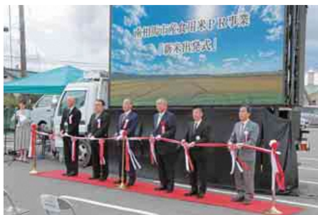
新米出発式・新米発表会〈10月22日〉