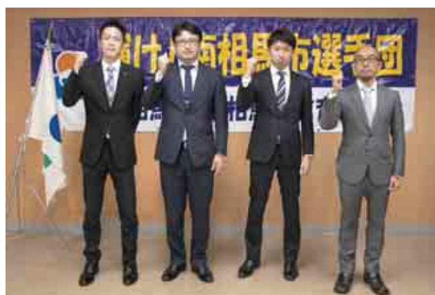
ふくしま駅伝市選手団壮行会〈11月4日〉