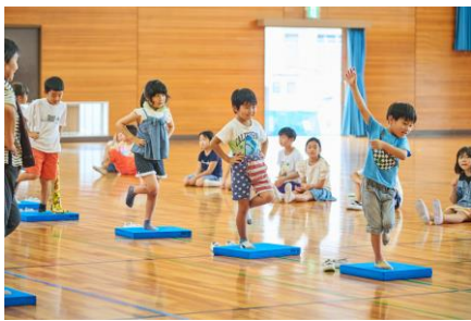
片足で立つのは難易度高め

9月13日（金）に放課後子ども教室にて「体操教室」が行われました。“体幹を鍛える”マット上での片足バランス運動や、“反射神経を養う”ネコ・ネズミの運動（4チームに分かれ、対抗戦実施）など、簡単にできる楽しい運動ばかりで、見ているほうも楽しくなりました。私も片足バランス運動をやってみましたですがすぐ倒れてしまいました(笑)もともと運動が苦手なのですが、楽しくできるようなヒントをもらったので、今度実践しようと思います！