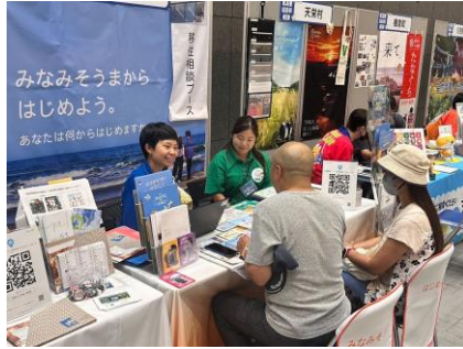
たくさんの方がブースに