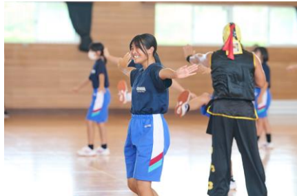
中学生も終始楽しそうでした