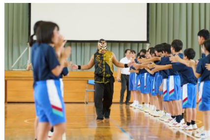
帰りはみんなでお見送り