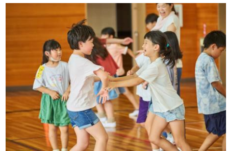
ネコ・ネズミそれぞれになってネコがネズミをつかまえるゲーム