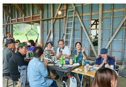
懇親会も大盛り上がり！