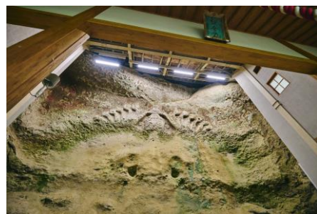
観音堂石仏も圧巻！