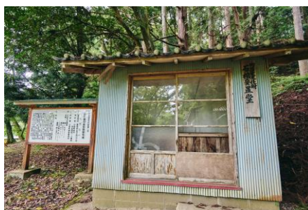
浦尻貝塚から出土した石棺が見えます