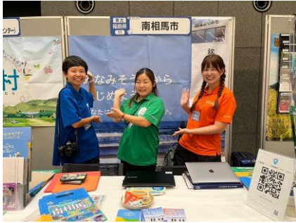
南相馬市ブースは、こちら！

他のブースでは可愛い被り物をしたスタッフさんがいたり、ガチャガチャ・ノベルティ配布など、楽しい工夫をされていて、次回出展の参考になりました。そろそろ移住して1年が経ち、たくさんの地域のイベントに参加したり、小高を撮り歩き勉強していたつもりでしたが、一緒にフェアに参加した方の情報量に驚き、私もより積極的に動いて南相馬市をアピールしていかないと、と強く思いました💖