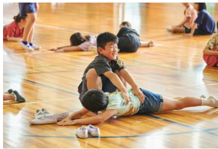
うつ伏せ姿勢の相手をひっくり返す大変さ