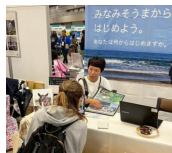
小高の魅力を紹介中