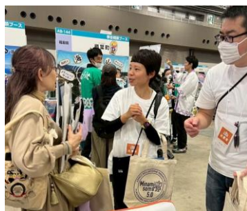
立ち寄ったお客様とお話