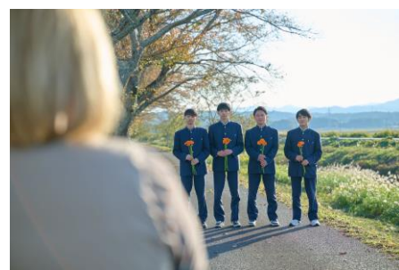
男子生徒も照れながら撮影