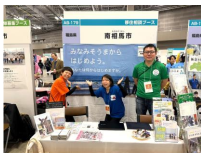
南相馬市カラー ポロシャツコーデ！

移住定住課の職員・移住相談窓口よりみちのスタッフと一緒に「移住フェア」に参加し、来場されたお客様に南相馬市の魅力を伝えてきました。福島県内の地域おこし協力隊が参加している自治体も多く、研修時に仲良くなった方との再会も。人が多い関東で働くことに限界を感じ、自然が近い環境で働きたいという方や、相馬野馬追を1度見てみたいという方などに、私が撮影した地元の写真を見てもらいました。地元の伝統行事などをきっかけに南相馬市を一度訪れて、現地で地域の魅力を体感してほしいです✧