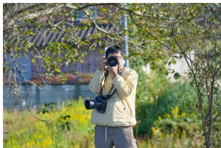
被写体の目線になって カメラマンを見てみた

新たな門出に立つ18歳の皆さんへの応援メッセージポスター「さあ、行っといで。」の制作の様子を取材してきました。最初は高校生たちが緊張の面持ちでしたが、スタッフさんがたくさん話しかけたり、カメラマンさんとポーズを相談していくうちに緊張がとけて、高校生たちの魅力が写真に写っていると思います📷2026年3月発行のおだかぐらし通信で詳しくお伝えしますので、お楽しみに！