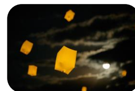
満月とスカイランタン