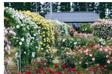
横田のバラ園@川房（5月）