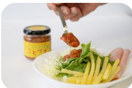
絶品サルサソース