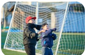
一緒に楽しく凧あげ