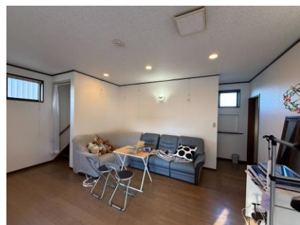
改装中の写真館の様子