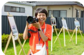
野外展示にチャレンジ！