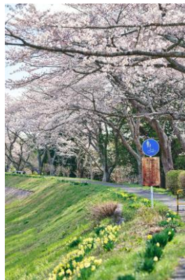
小高川の桜並木（4月）