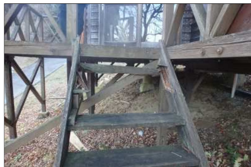
< バンガロー階段破損箇所 >