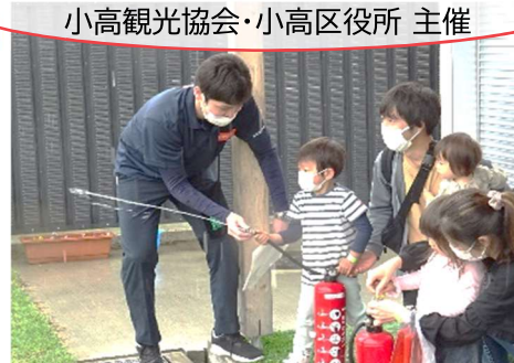
おだかるフェスタ 小高観光協会・小高区役所 主催