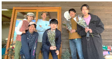
小高の花農家 hinataba 様

移住定住のきっかけづくりとして、小高区を知り、実際に小高区を体験するツアーを実施！