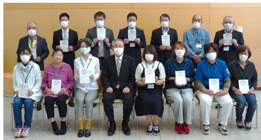
地域のお世話人 登録証交付式