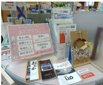
おだかぐらし担当窓口の様子 (小高区役所内 1階)