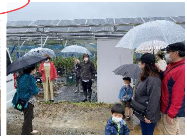
現地ガイドと小高をめぐる おだかるツアー