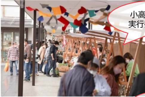
小高つながる市 実行委員会 主催