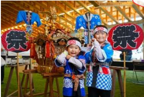
子供みこしと写真撮影会