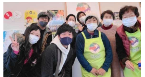
小高マルシェの皆様