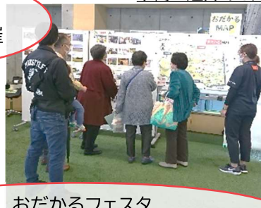
小高の魅力ある人と場所を紹介したおだかるMAP