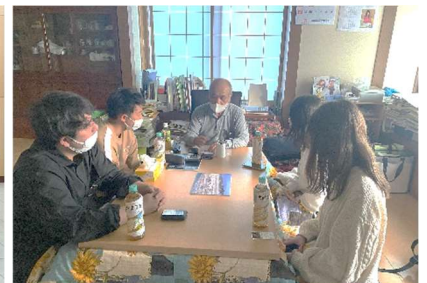
地域のお世話人 活動の様子