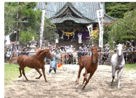
野馬懸 @相馬小高神社