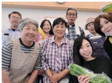
「小高マルシェ」にて @小高交流センター内

参加者の声「Tさん」 「私の知らない南相馬に出会えました！暮らししている人の声が聞いてとても良かったです！」