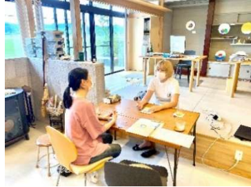
「粒粒」にて @小高区耳谷

Tさんより 「今まで知らなかった南相馬の魅力に出会うことができ、とても有意義な時間になりました！」