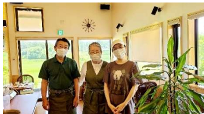
「香音珈琲」にて @小高区小屋木