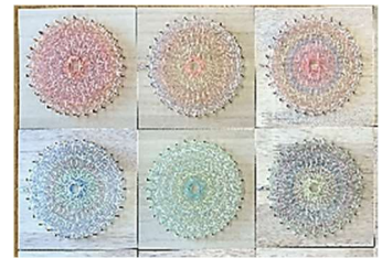
糸かけマンダラ 完成作品