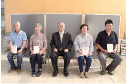
新たにご協力いただける農家さんたち

「農のある暮らし」について興味がある移住検討者などを対象に、地域のお世話人が小高区での暮らしぶりをお伝えします◎