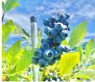
きれいに実ったブルーベリー♡