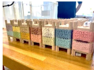
色染め後のカラフルな絹糸