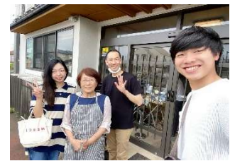
「双葉屋旅館」にて @小高区東町

参加者の声「Wさん」 「小高の顔が見れた気がします！ また、小高に訪れたいです！」