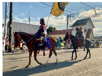
帰り馬の騎馬武者