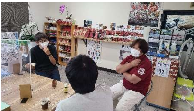
「小高工房」にて @小高区本町

今年度も、移住検討者に向けたツアーがスタート！ 小高の温かい方々、小高で挑戦する人たち、小高の今を感じてもらおうツアーです。