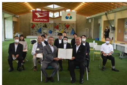
9/30(土) 協定締結式 @小高交流センター

小高区への移住定住促進を目的とした、『小高駅前カーシェアリング実証サービス』がスタート。車をお持ちでない方、電車などで小高区に訪れる方、小高区に滞在している方など、移動手段のひとつとしてぜひご利用ください！