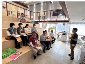
小高パイオニアヴィレッジ(本町)