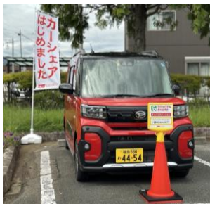
ダイハツステーション小高駅前