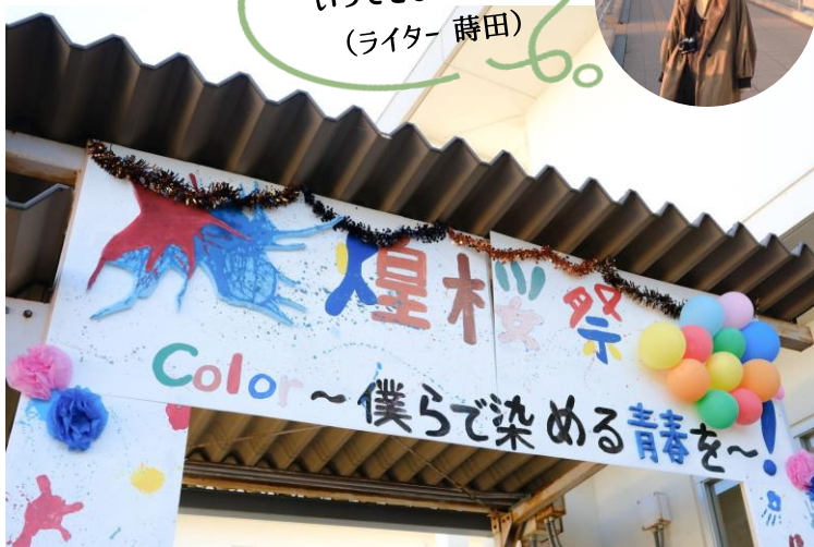
▲『煌桜祭』の愛称で親しまれる文化祭。手作り看板にはテーマを添えて