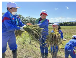
稲を運ぶこどもたち