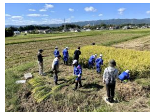
大地のめぐみ(片草)