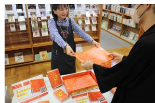
南相馬市立中央図書館にて