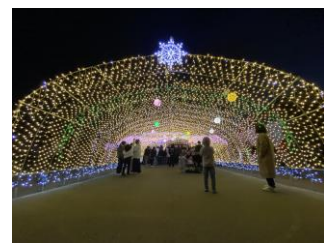
R4.11/小高ふれあい広場

11月18日(土)は、『Winter Festival '23@小高交流センター』『あかりのファンタジーイルミネーション in小高』が開催されます！もうすぐ12月🌨️ 澄んだ空気にイルミネーションが綺麗に映えます🌟ぜひ小高区へお越しください！🚗🌟