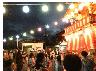
令和4年8月盆踊り大会

もうすぐ夏がやってきます☀小高区では7月30日(日)は“火の祭” 8月12日(土)は“おだか夏まつり”が開催されます！盆踊り大会も 同時開催！みなさんのご参加お待ちしております☺