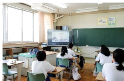
▲ 何度も繰り返し見ている教材を暗唱する6年生