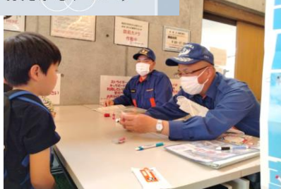
消防団による防災クイズ