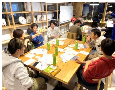
第一回 ワークショップ