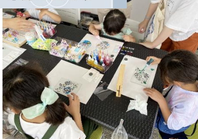
icoiさんによるおしごとマルシェ