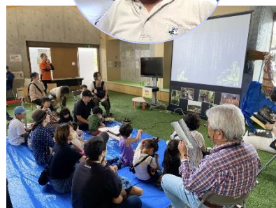
懸の森物語 読み聞かせ