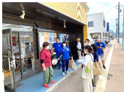
おだかるさんぽ @小高工房