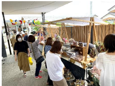
モノづくりマルシェ