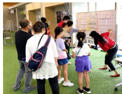
クイズに挑戦中(おだかるフェスタ)