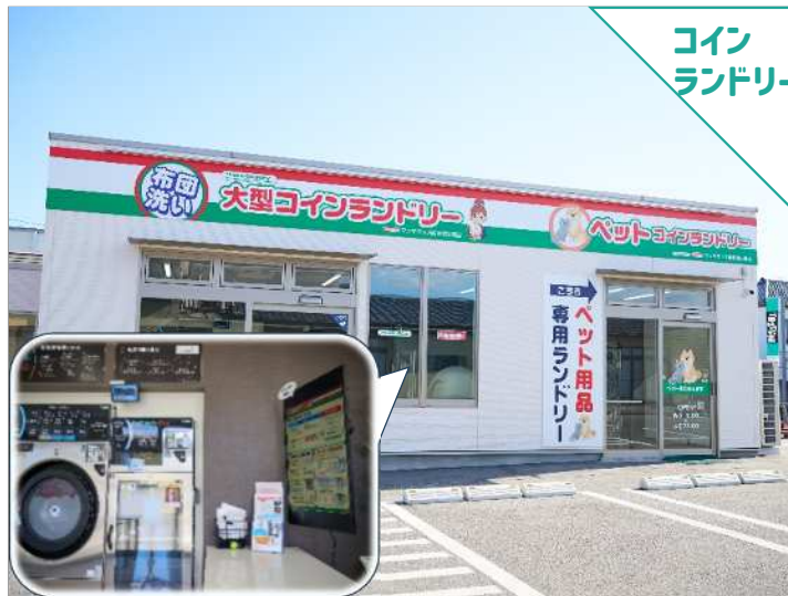
コイン ランドリー