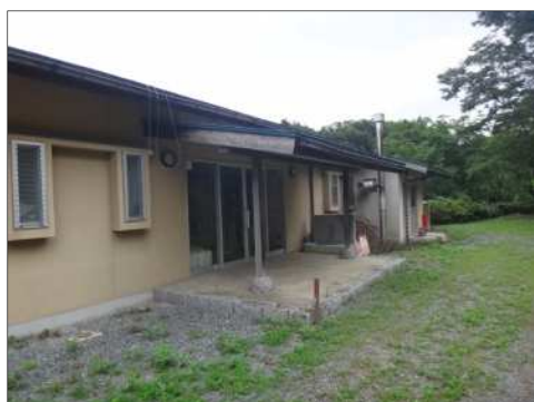
【農業体験実習館（正面玄関）】