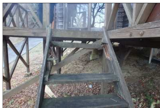
< バンガロー階段破損箇所 >