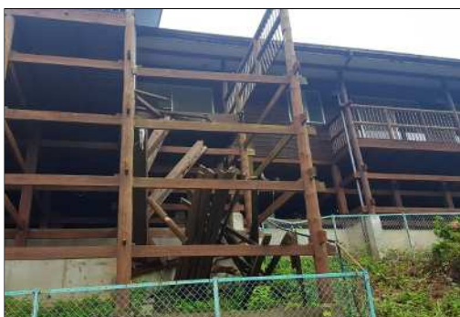
< 農業体験実習館デッキ破損箇所 >

活性化施設は、施設及びその周辺の空間線量率が、国で定める基準 0.23 \mu Sv/h を上回っている個所が多い状況 4 にある。