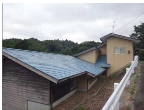
【農業体験実習館（北側）】