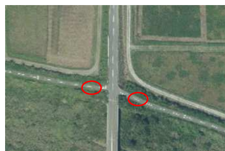
薬師堂橋付近 上流下流