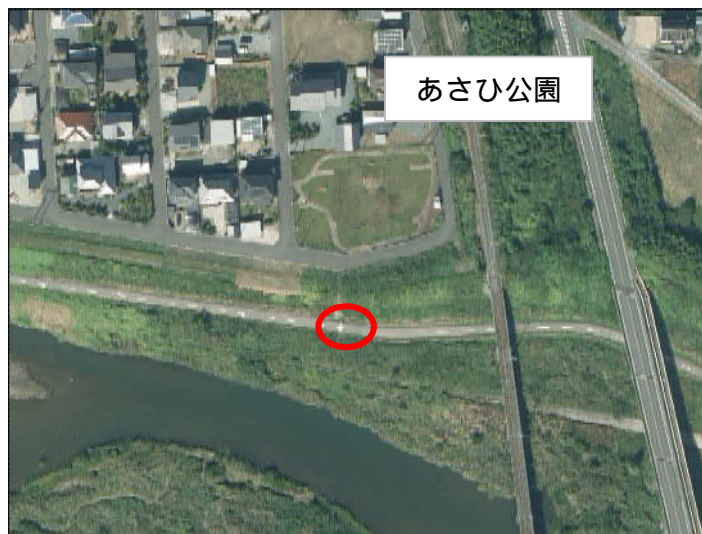
鹿島区あさひ地内