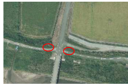
中川原橋付近上流下流