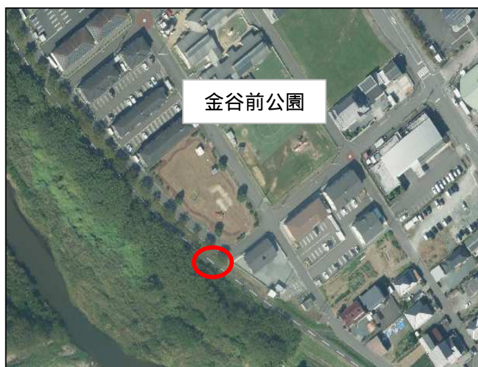
鹿島区西町3丁目地内