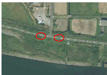
鹿島字下川原地内 上流下流側