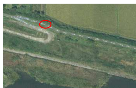
6号線真野川橋東側 1ヵ所