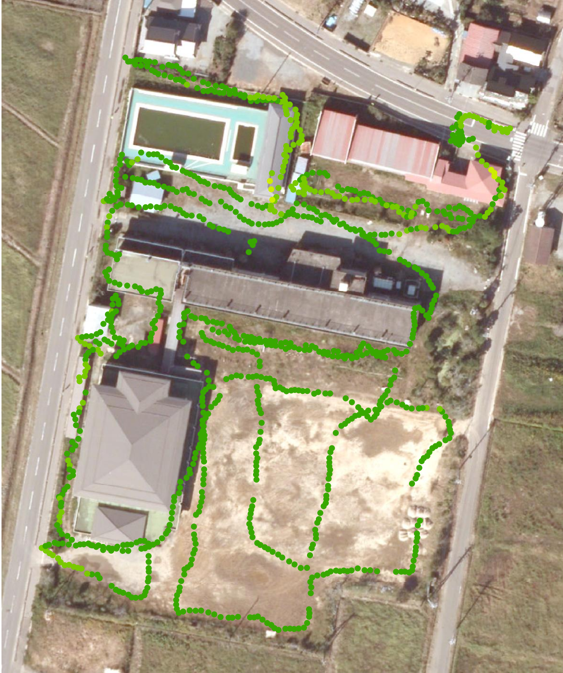
真野小学校と幼稚園（測定日：2012年6月28日、高さ50cm）