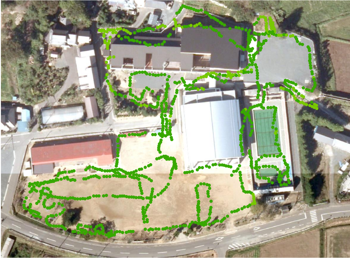
八沢小学校と幼稚園（測定日：2012年6月28日、高さ50cm）