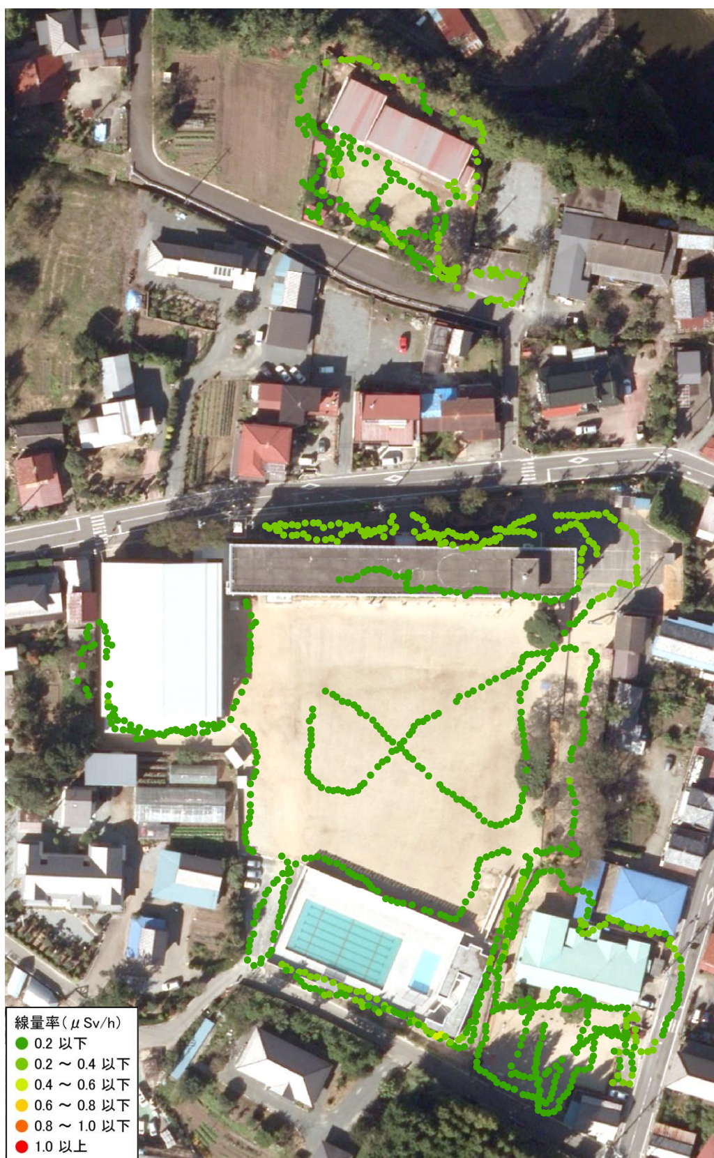
上真野小学校と幼稚園と保育園(測定日:2012年6月28日・7月20日・13日、高さ50cm)