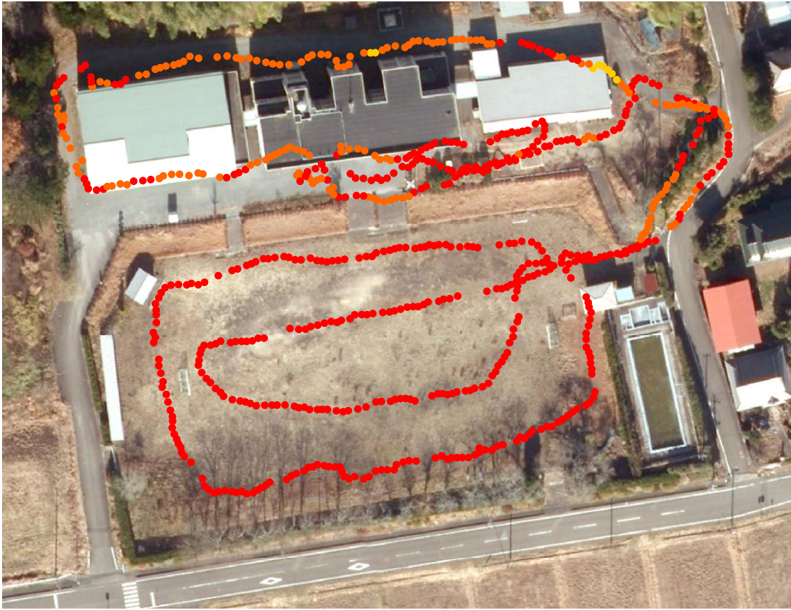
鳩原小学校と幼稚園（測定日：2012年5月26日、高さ50cm）