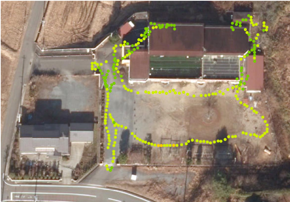
小高保育園（測定日：2012年6月23日、高さ50cm）