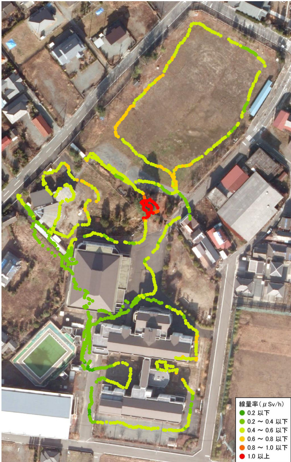
小高小学校と幼稚園（測定日：2012年6月23日、高さ50cm）