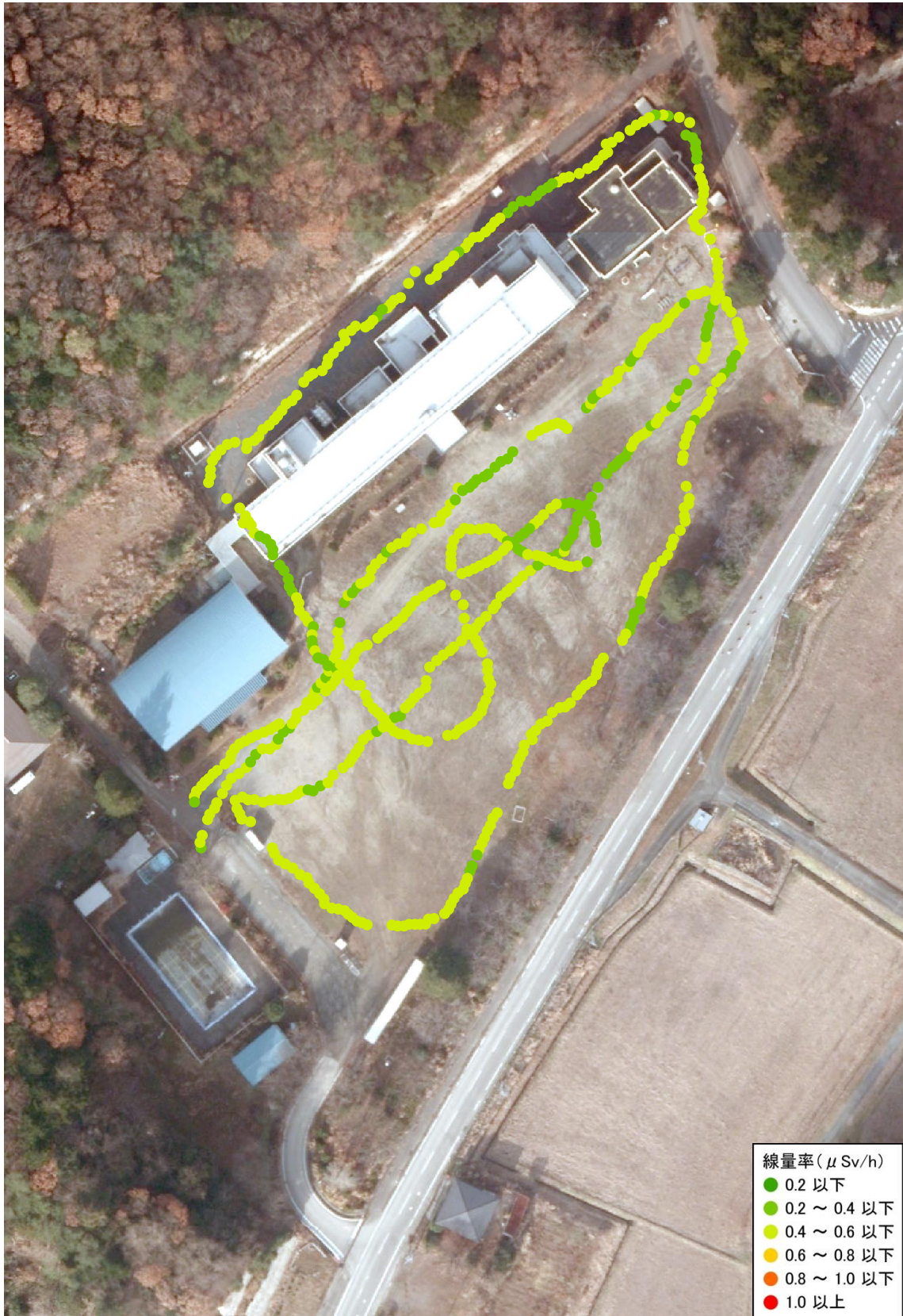
福浦小学校と幼稚園（測定日：2012年6月23日、高さ50cm）