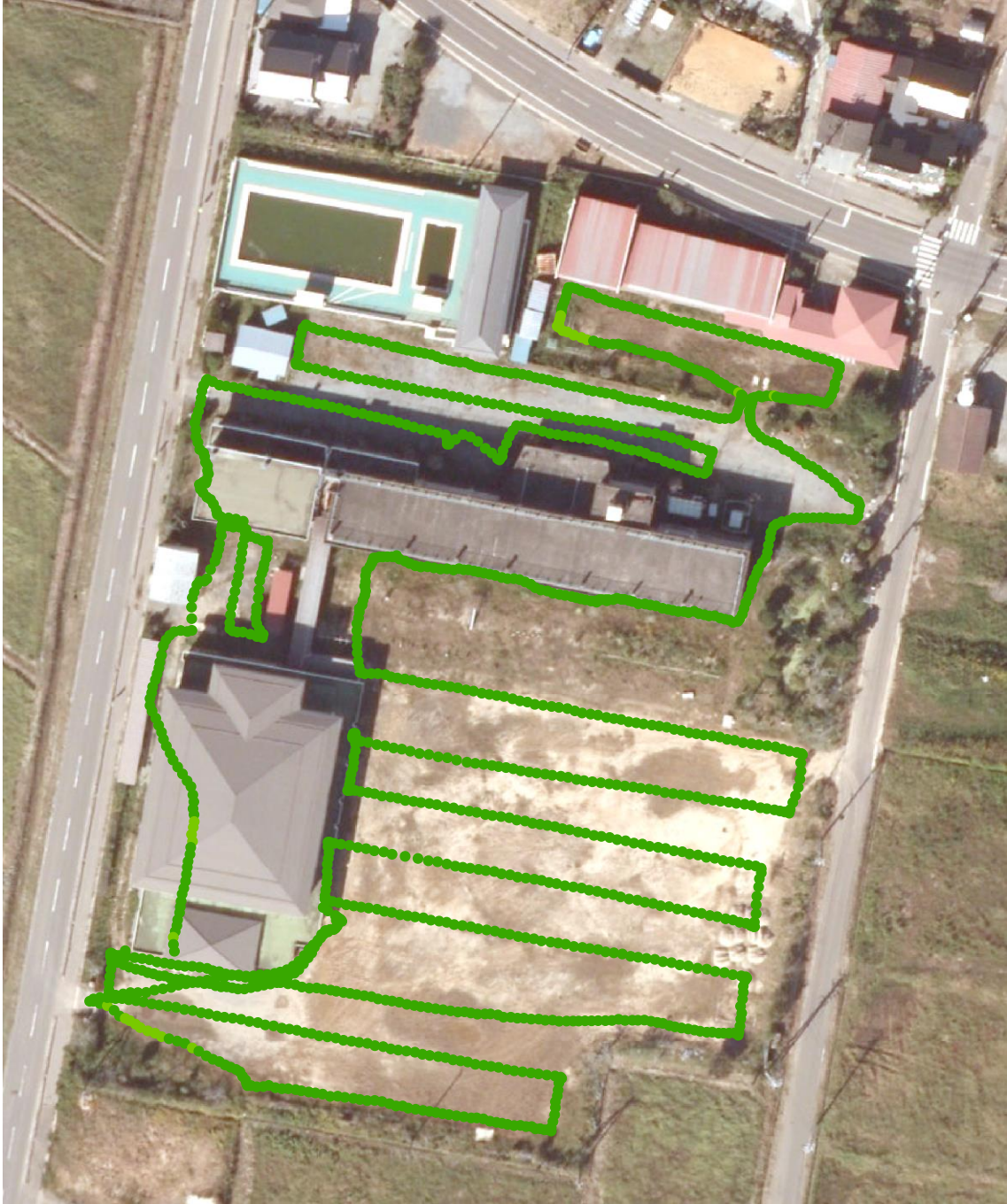
真野小学校と幼稚園（測定日：2013年8月19日、高さ50cm）