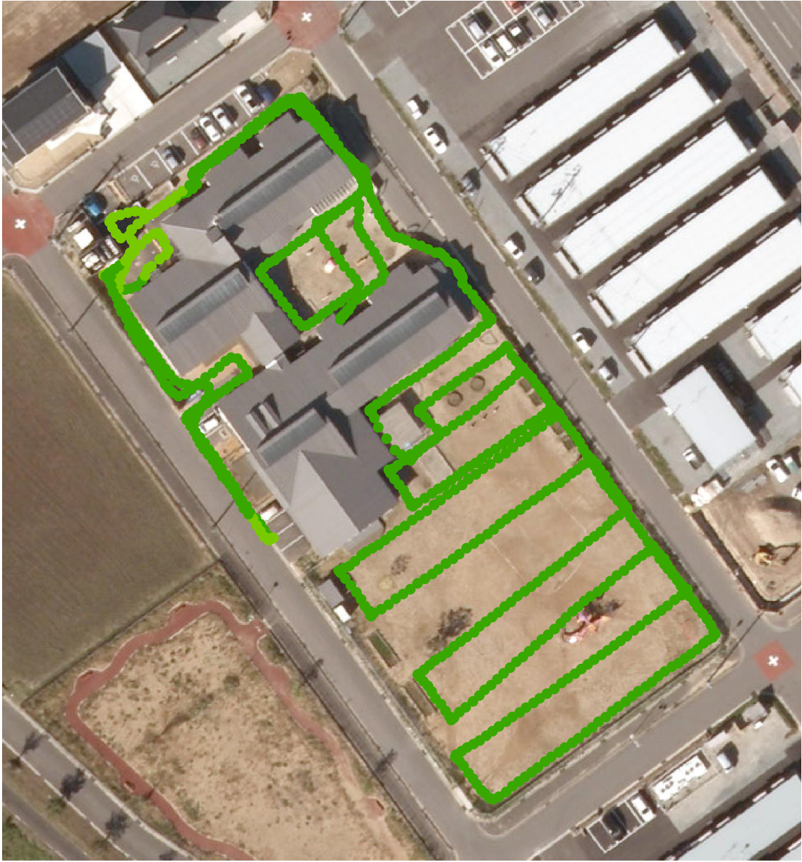
鹿島保育園（測定日：2013年8月21日、高さ50cm）