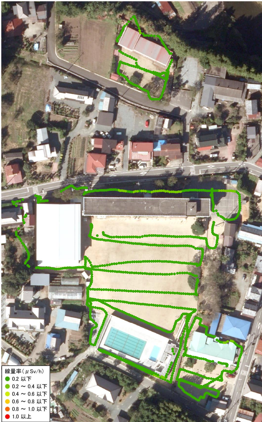
上真野小学校と幼稚園と保育園（測定日：2013年8月21日、高さ50cm）