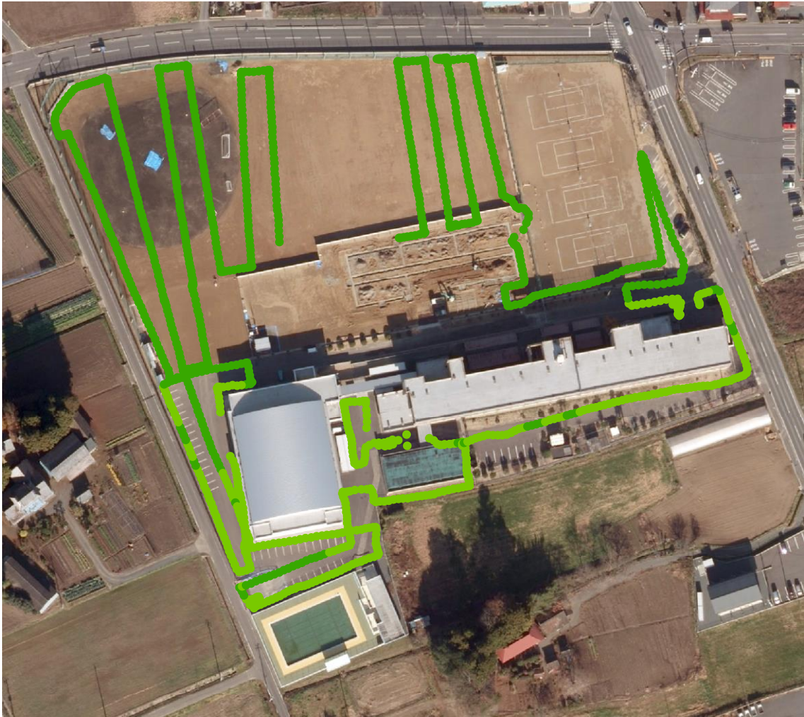
石神中学校（測定日：2013年8月29日、高さ100cm）