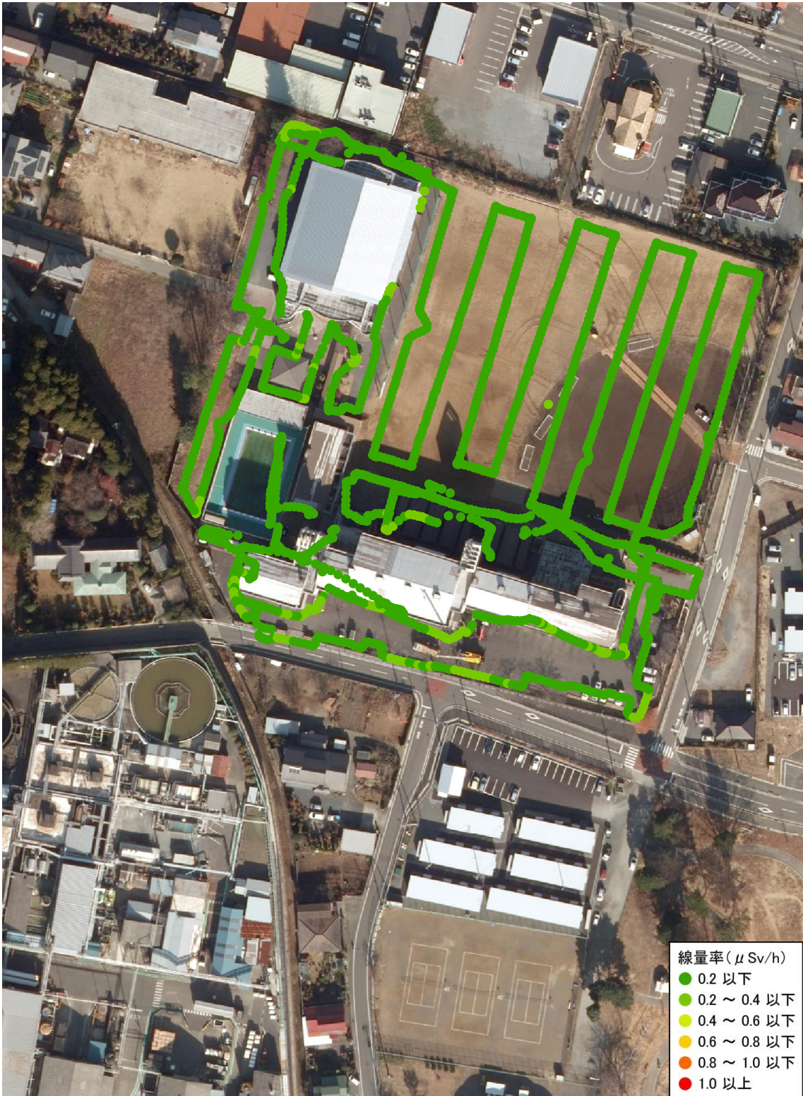
原町第二中学校 (測定日 : 2013 年 8 月 30 日、高さ 100cm)