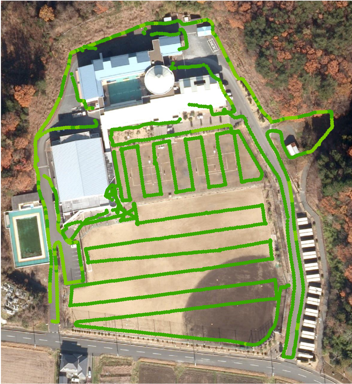
原町第三中学校（測定日：2013年8月30日、高さ100cm）