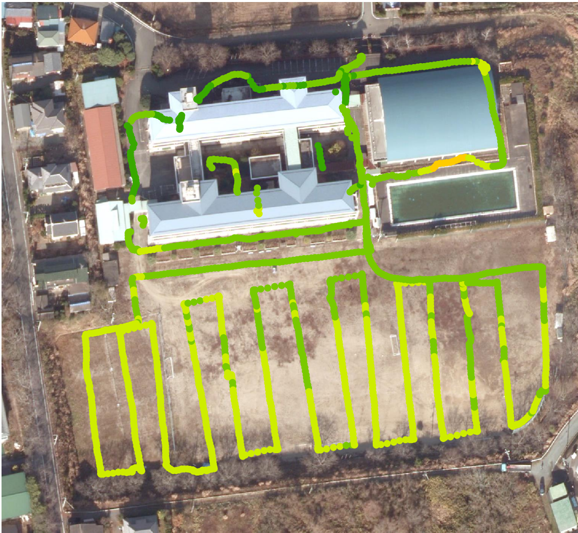
小高中学校（測定日：2013年8月22日、高さ100cm）