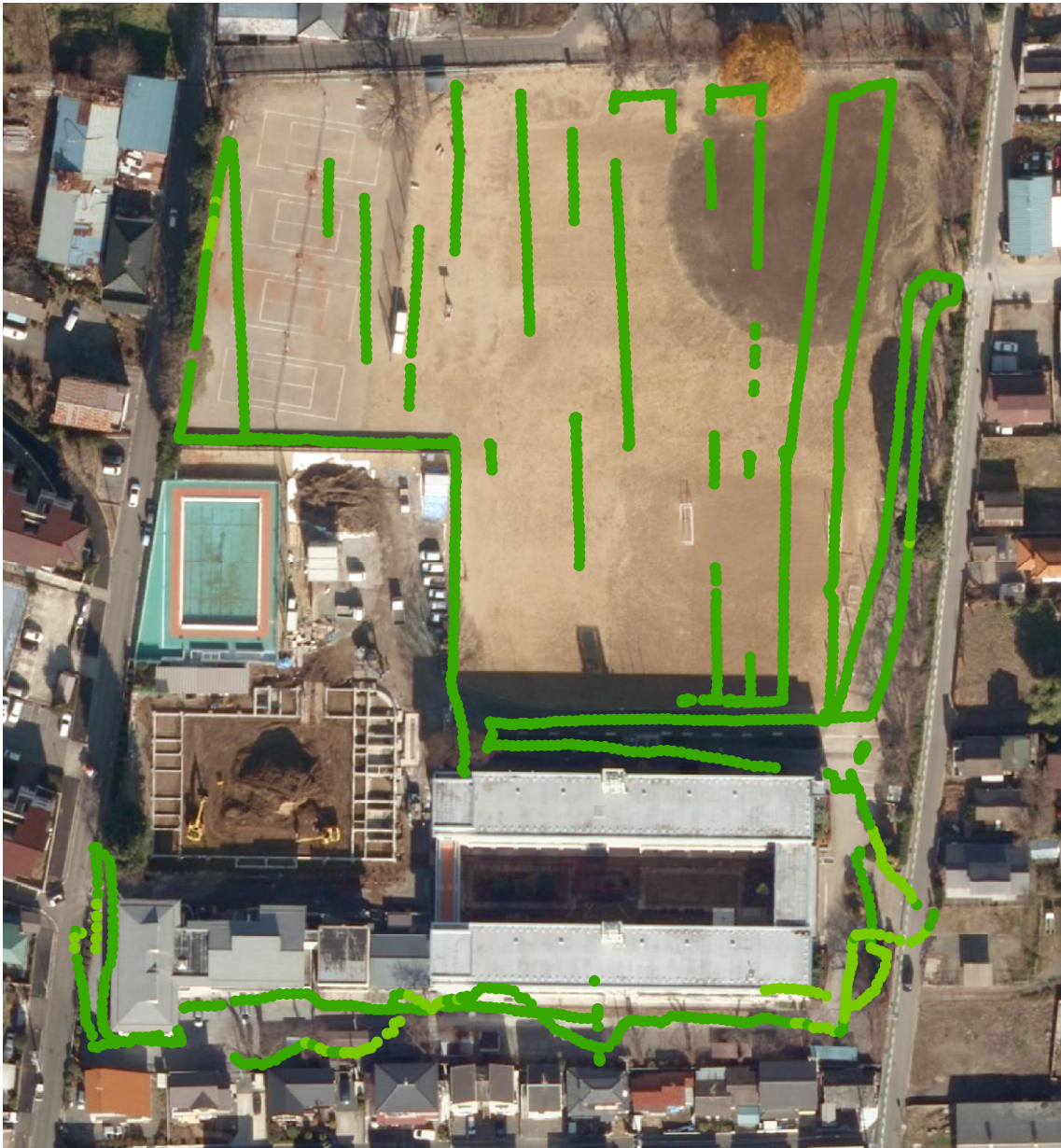
原町第一中学校 (測定日 : 2013 年 9 月 9 日、高さ 100cm)