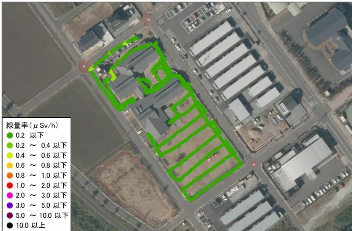
かしま保育園（測定日：2014年5月30日、高さ50cm）