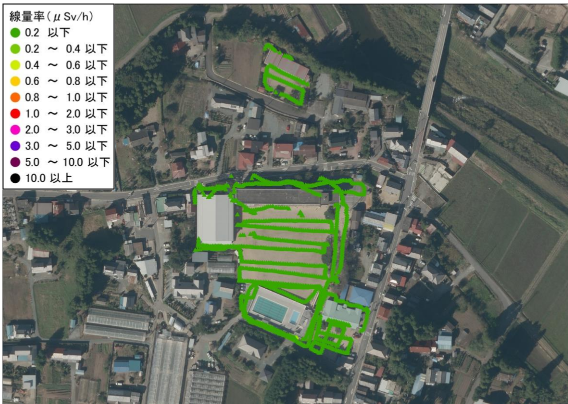
上真野小学校と上真野幼稚園（測定日：2014年6月19日、高さ50cm）