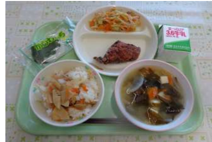
たけのこごはん、牛乳、赤魚竜田揚げ、キャベツのからし和え、わかめの味噌汁、柏餅 (端午の節句献立)