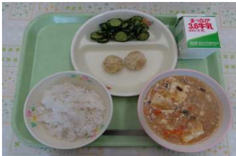
麦ご飯、牛乳、麻婆豆腐、パオズ、キュウリの華風漬け