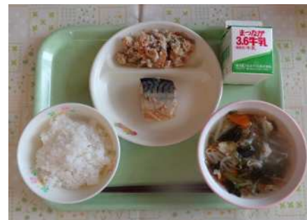
ごはん、牛乳、さばの味噌煮、卵の花入り、もずくスープ