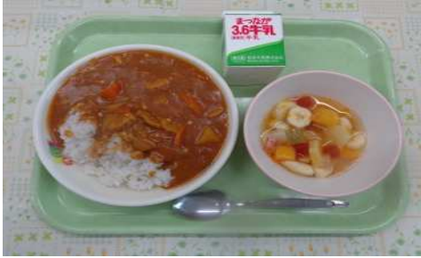
チキンカレー、牛乳、フルーツポンチ