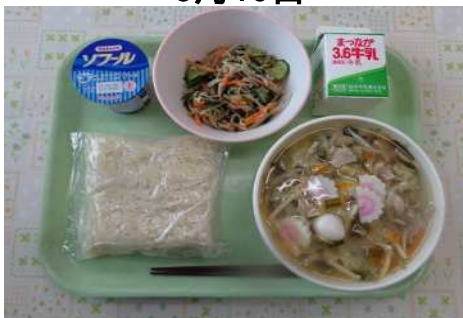
タンメン、牛乳、中華和え、ヨーグルト