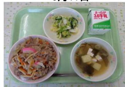
トントン拍子丼、牛乳、レモン漬け、じゃがいもの味噌汁