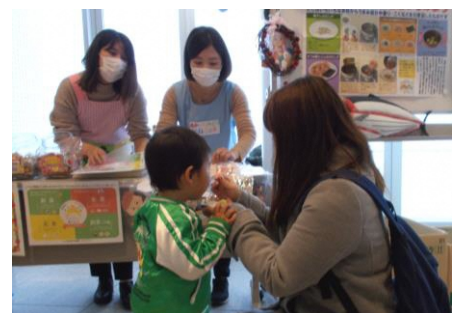
たくさんの親子が、試食やクイズなど参加されていきました。

かつお節でとっただしと、かつお節と昆布の混合だしの飲み比べをして、みなさん味の違いに驚いていました。