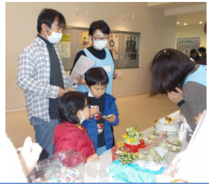
給食でも提供されている「和風ポテトサラダ」の試食をしてもらい、「おいしい」と評判でした。