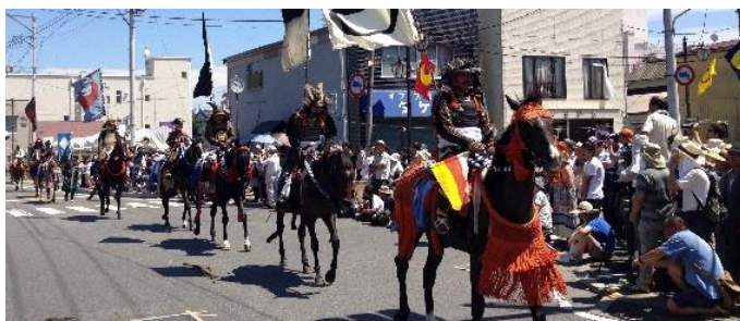
野馬追通り御行列の様子（原町区）