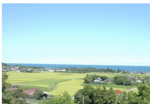
浦尻貝塚（小高区）から望む太平洋（震災前）