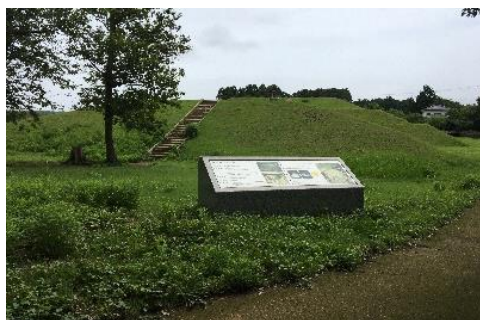
桜井古墳公園（原町区）