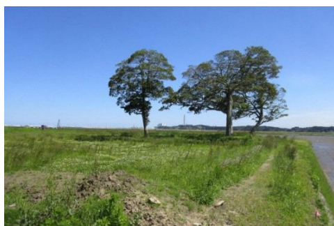
北右田のタブノキ（鹿島区）