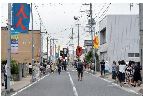
小高駅前通り（小高区）