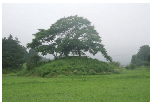
横手古墳群（鹿島区）