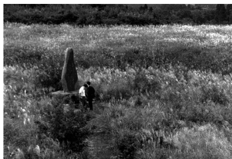
万葉集に歌われた地域（鹿島区）