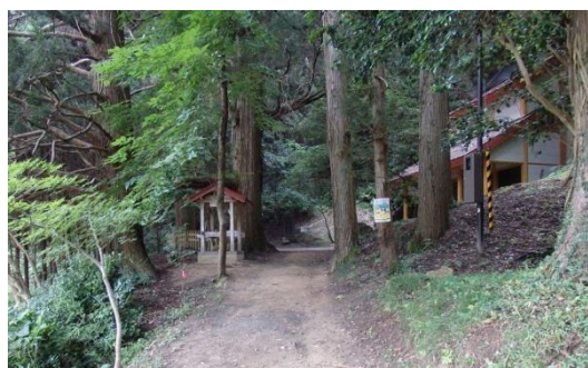
大悲山の石仏（観音堂）と周辺環境（小高区）