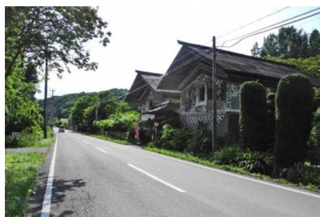
大谷家住宅土蔵と門（鹿島区）