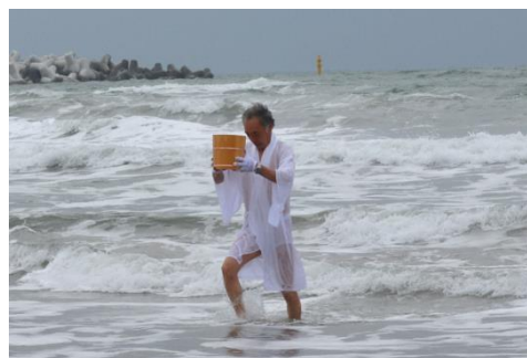
浜下り行事（鹿島区）