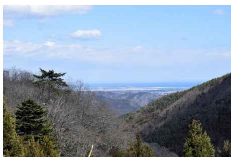
塩の道から眺める景色（鹿島区）