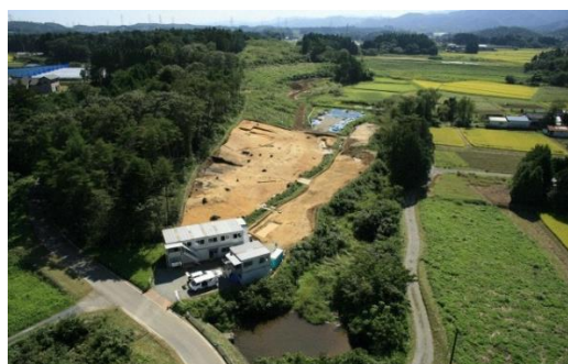
横大道製鉄遺跡（小高区）