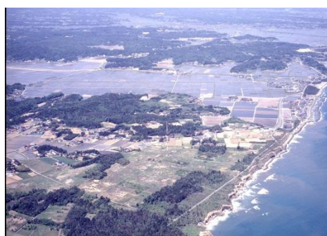
浦尻貝塚と旧井田川浦周辺（小高区）