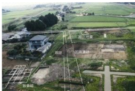
泉官衙遺跡（原町区）